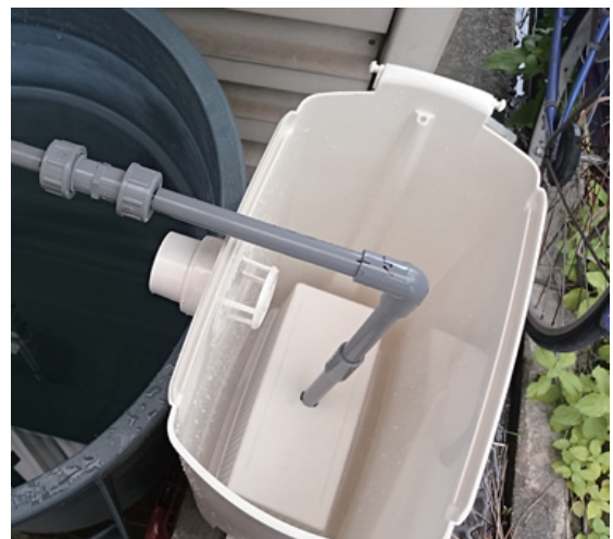
砂利を沢山入れてください。