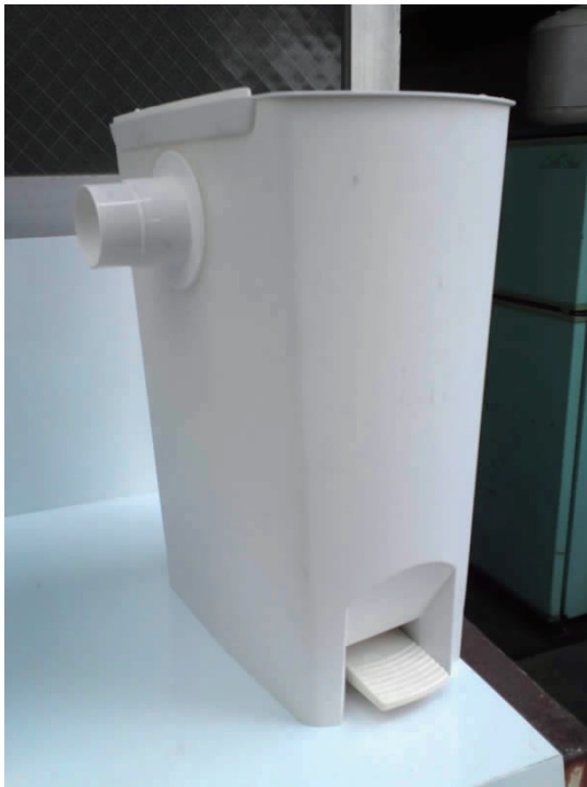
ゴミ箱が微生物のお家です。