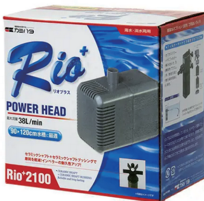
カミハタのポンプ