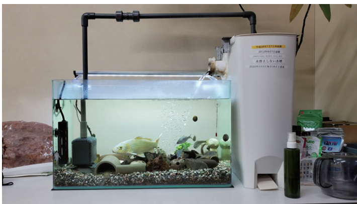
水流に弱い生体はNG。