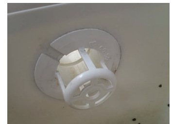
雨どいのドレンです。